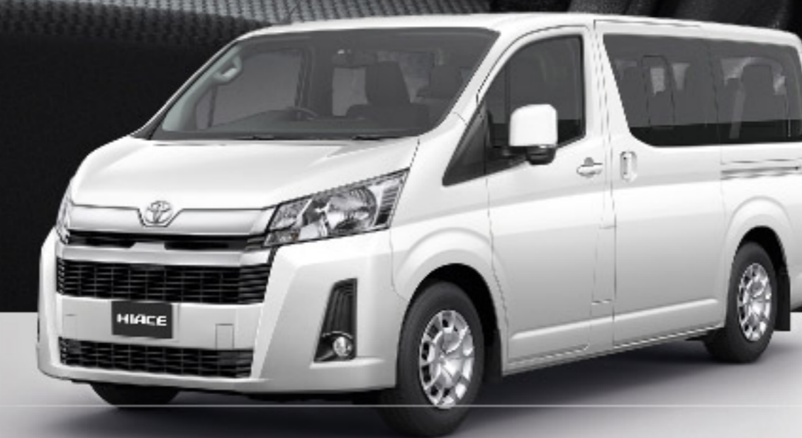
HIACE GL AT